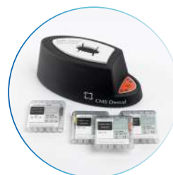
Soft-Core® Fornetto Intro kit