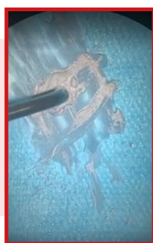
Caricamento della siringa con MTA